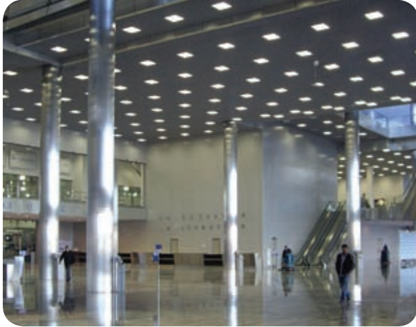
Международный выставочный центр «Крокус-Экспо» (Москва)