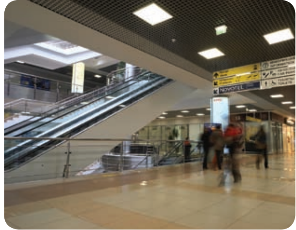
Аэровокзал аэропорта «Шереметьево» (Москва)